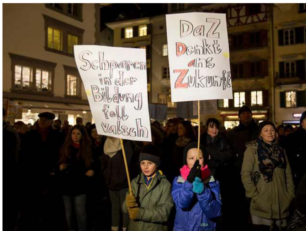
«Foll vatsch»: An der Demonstration gegen Sparmassnahmen in Luzern wehren sich auch Kinder gegen Abbau bei der Bildung.